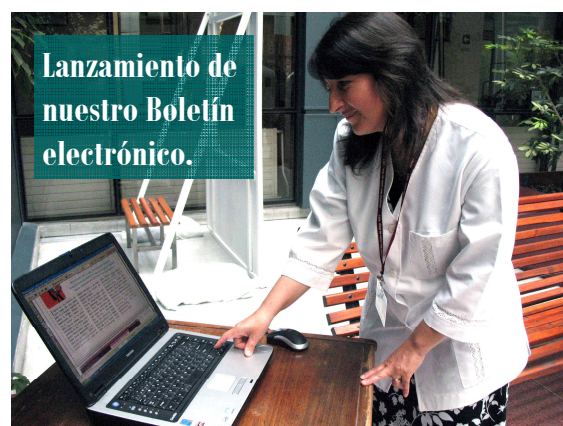
Lanzamiento de nuestro Boletín electrónico.