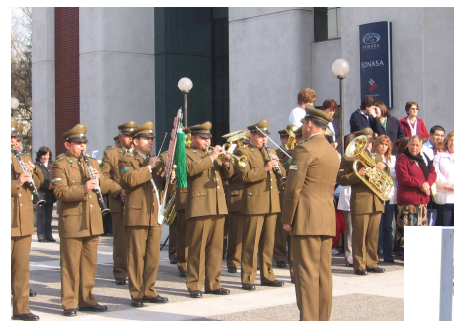
Saludo del Orfeón de Carabineros.