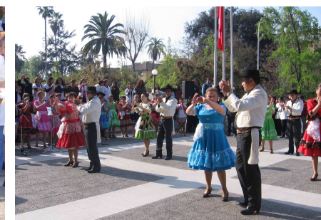
Actuación del grupo 'Alicanto'.